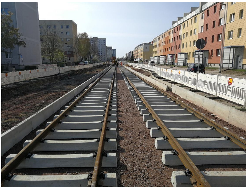
Verlegte Gleise in der Johannes-R.-Becher-Straße

Die Tiefbauarbeiten in der nördlichen Johannes-R.-Becher-Straße sind weitestgehend abgeschlossen. In den vergangenen Monaten wurden aufwendig unterirdische Versorgungsleitungen verlegt und neu gebaut. Die neu angelegte Straße ist zwischen Hanns-Eisler-Platz und der neuen Wendeschleife für die Straßenbahn fertiggebaut. Auch die Fußwege auf der Westseite der Johannes-R.-Becher-Straße wurden neuerrichtet und dabei sparsame LED-Straßenleuchten verbaut. Aktuell wird das neue Straßenbahngleis verlegt und die Stromversorgung für die neue Trasse vorbereitet. Dazu werden neben den Schienen Gleichstromkabel verlegt.